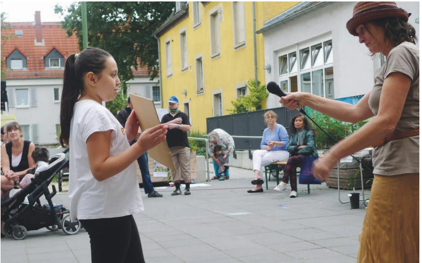
Feste feiern im Riederwald – auch mit Abstand!

Ortsbeirat: Vorstellung der „Riederwälder“ im neu gewähl- ten OBR 11