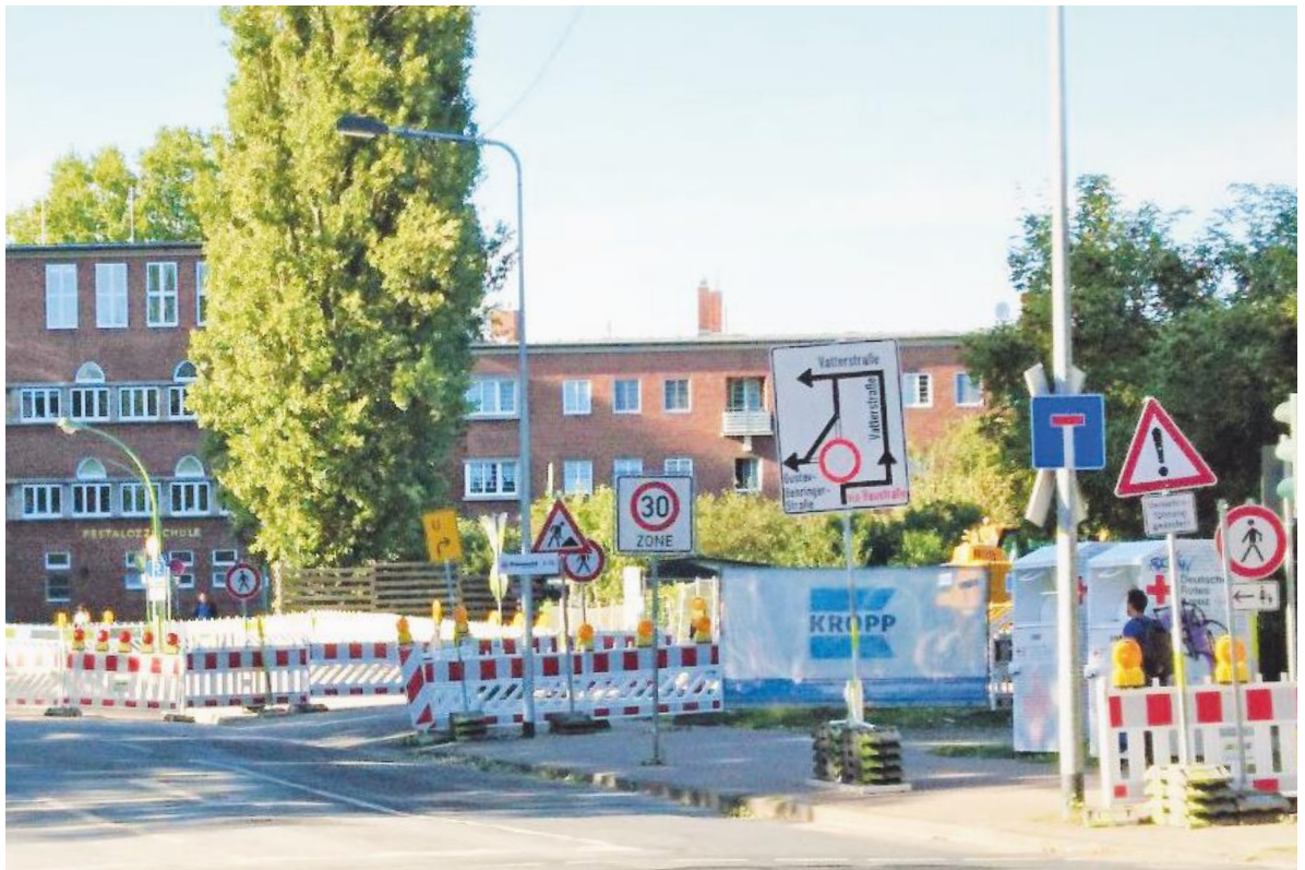
Baustelle an der Pestalozzischule.

Jetzt kommen erste zaghafte Vorschläge (ohne Termine!): Verlängerung U4 bis Atzberg; Stadtbahn über die Wächtersbacher zur zukünftigen S-Bahnstation in Fechenheim Nord, Verlängerung der U7 bis Riedbad. Aber schnell realisierbare Vorschläge der BIR, wie eine Verbilligung der Fahrscheine nach Hanau durch Streichung einer Tarifzone plus P&R-Plätze entlang der Regionalbahn, sowie Reaktivierung der Stadtbahn nach Bergen fehlen weiterhin! Auch bei den Radwegen keinerlei Fortschritt! Der Radweg durch den Riederwald (Wald) könnte sogar zu Konflikten mit Fußgängern führen, wenn der Radverkehr weiter zunimmt.