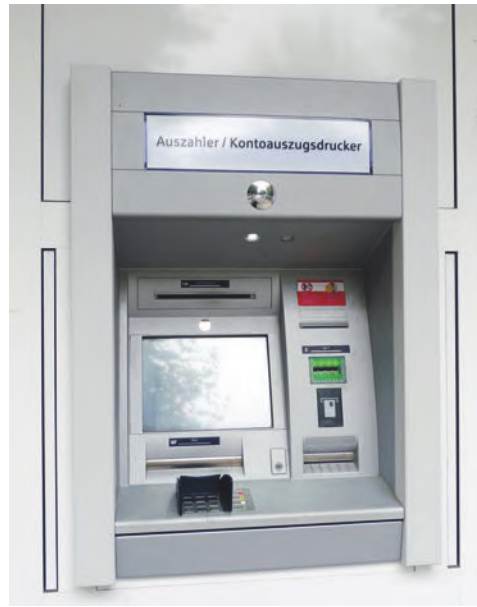
Die alte Sparkassenfiliale – nur der Geldautomat ist geblieben.

„Die Frankfurter Sparkasse bietet als Teil des Konzerns der Helaba Landesbank Hessen Thüringen und mit ihren Partnern aus der Sparkassen-Finanzgruppe sämtliche Finanzdienstleistungen für Privat-, Gewerbe- und Firmenkunden. Die persönliche Beratung ist der wichtigste Grund für 40 Prozent aller Frankfurter, ihre Bankgeschäfte mit der Frankfurter Sparkasse zu tätigen. Hierfür verfügt sie in der gesamten Region über das dichteste Netz von Filialen und Beratungszentren.“ (Zitat aus dem „Unternehmensportrait“ auf der Seite der Frankfurter Sparkasse im Internet).