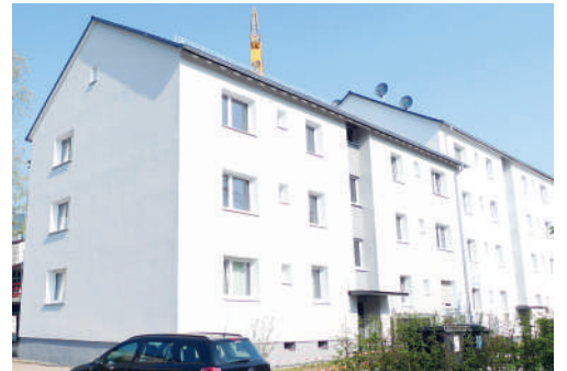
Vatterstraße 46, heute