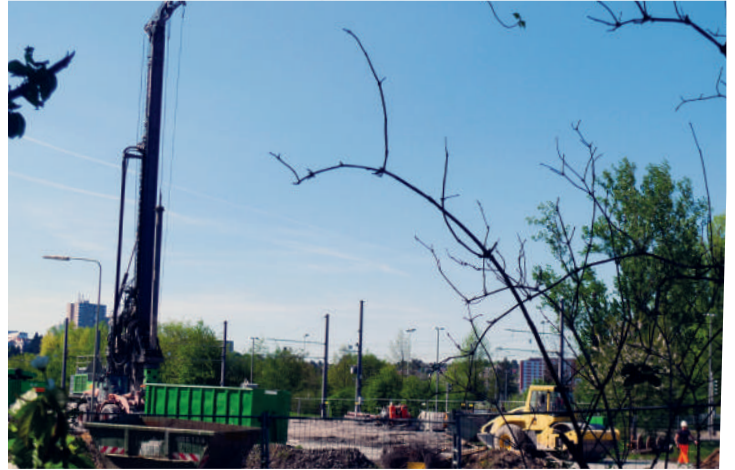
Arbeiten an einer Leitungsbrücke

Die Prognosen rechnen mit der Entlastung durch Elektromobile. Könnte das etwas ändern? Was die Luftqualität angeht