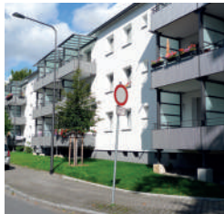
Die Vatterstraße verändert sich.