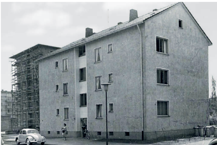
Vatterstraße 49, 1954/55