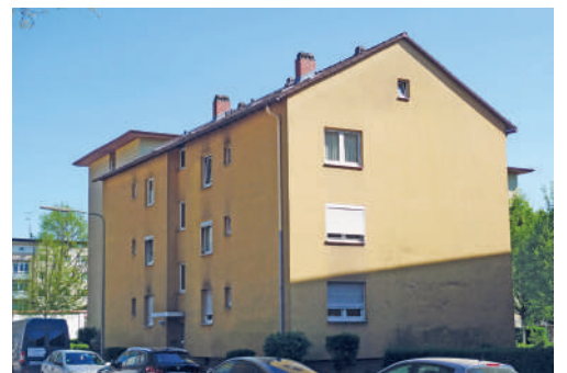
Vatterstraße 49, heute