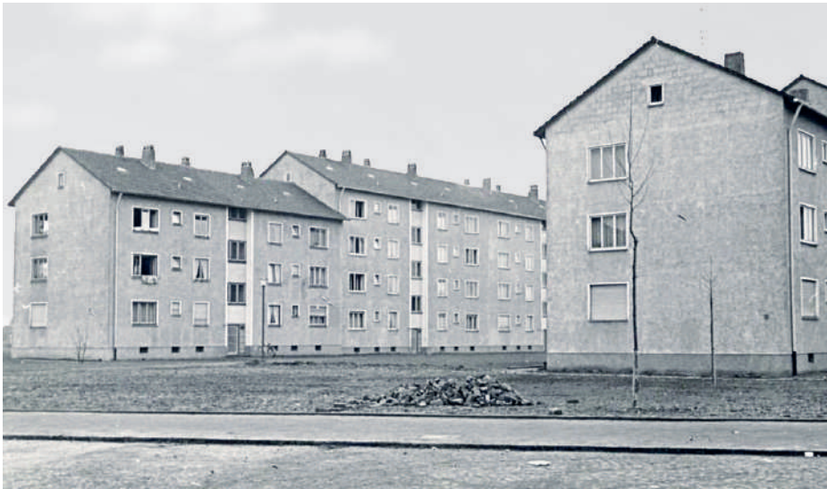
Vatterstraße 46, 1954/55

Wahrscheinlich wegen der unterschiedlichen Farbgebung an den Außenwänden der Wohnhäuser. Die Häuser mit den geraden Hausnummern südlich der Vatterstrasse gehören zur Wohnheim, die mit den ungeraden Hausnummern nördlich der Vatterstraße zur Nassauischen Heimstätte. Der Volksbau baute das Haus mit der Adresse Flinschstr. 5–7. Errichtet wurde am östlichen Ende der Siedlung ein Konsum und später entstand auch ein Kino, von dem die Redaktion allerdings nicht weiß von wann bis wann es betrieben wurde. Zumindest bei Bau und Bezug der Wohnungen in den neu errichteten Häusern wurde die Siedlung noch eindeutig dem Riederwald zugeordnet. Rein formal aber gehört die Siedlung ebenso wie die Schule heute zur Gemarkung Seckbach. B.M.