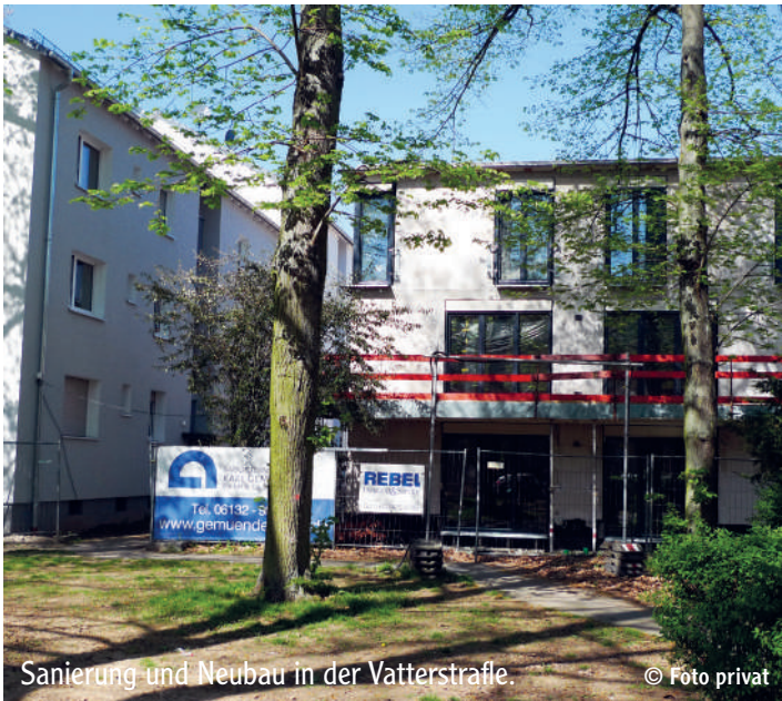
Sanierung und Neubau in der Vatterstraße.