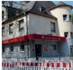
Die Sparkasse darf nicht geschlossen werden!