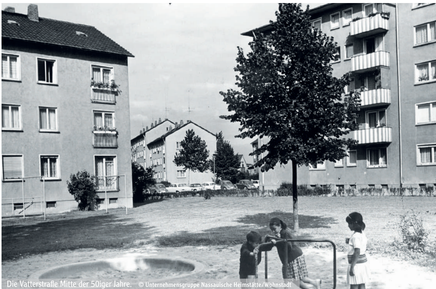
Die Vatterstraße Mitte der 50iger Jahre.