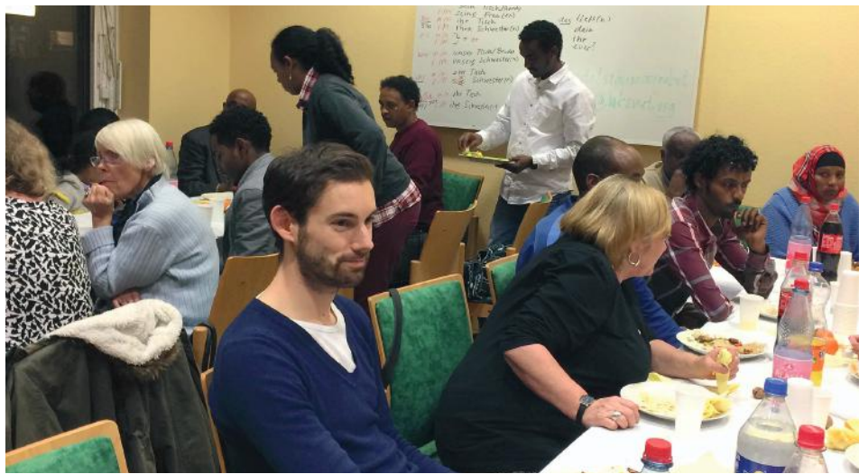
Flüchtlinge und Riederwälder haben für ein gemeinsames Essen Geld gespendet und zusammen gefeiert.

Die Übergangsunterkunft in der Fabriksporthalle ist nun aufgelöst worden, die in den anderen Sporthallen ebenfalls; alle Flüchtlinge, die noch nicht registriert und zugewiesen sind, aber in Frankfurt untergebracht werden müssen, leben nun im Neckermann-Gebäude, das eine Außenstelle der Erstaufnahmeeinrichtung Gießen darstellt. Dort werden ca. 2.000 Menschen für bis zu 6 Monaten leben müssen, davon wahrscheinlich bis zu 500 Kinder. Ob im Neckermann-Gebäude menschenwürdige Zustände organisiert werden können, ob die medizinische Betreuung ausreicht, die Versorgung klappt, ob Kinder betreut werden können oder zur Schule gehen – all das ist noch nicht geklärt. Eines aber ist klar: Die Menschen dort werden über kurz oder länger in andere Gemeinden in ganz Hessen verteilt, nur wenige bleiben in Frankfurt. Von denen, die nach Frankfurt zugewiesen worden sind, die hier also längere Jahre leben werden, sind viele im Frankfurter Osten untergebracht worden. Das liegt daran, dass hier in Frankfurt-Ost große Gewerbegebiete mit z.T. schon älteren Verwaltungsgebäuden liegen, es gab eine Menge Leerstand. Solche Gebäude werden jetzt ein wenig umgebaut und als Unterkünfte verwendet; viele dieser Gebäude sind nicht wirklich gut dafür geeignet. Als zusätzliche Möglichkeit hat die Stadt Frankfurt Containeranlagen aufgebaut, in denen Menschen bis zu 2 Jahren lang leben sollen. Und ständig werden weitere Menschen nach Frankfurt zur Unterbringung