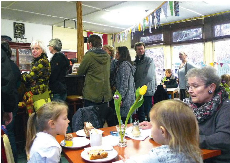
Eröffnung des Stadtteilcafés am 31. Januar 2016. Ein voller Erfolg!

Zusammen geht was! Großer Andrang bei der Eröffnung des Stadtteilcafés mit Live-Musik und Bingo.